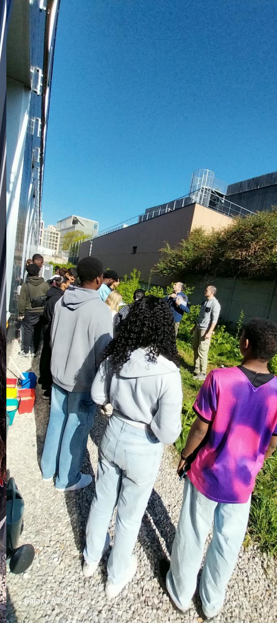
Galaxy A23 5G