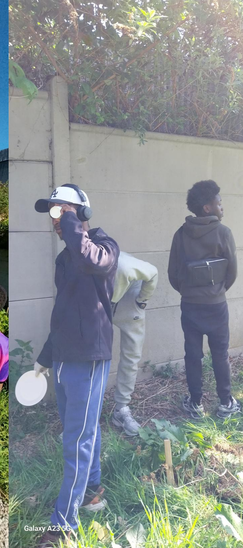
Galaxy A23 5G