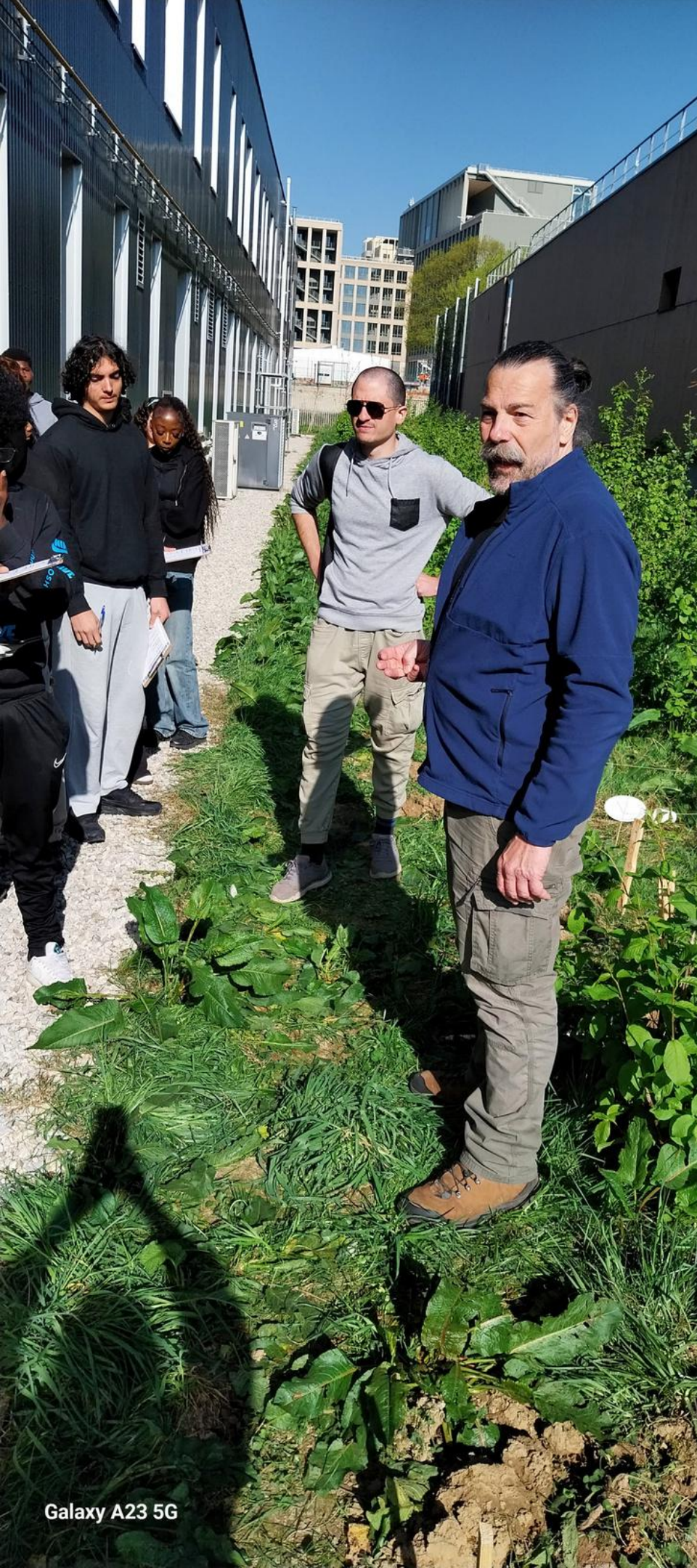
Galaxy A23 5G