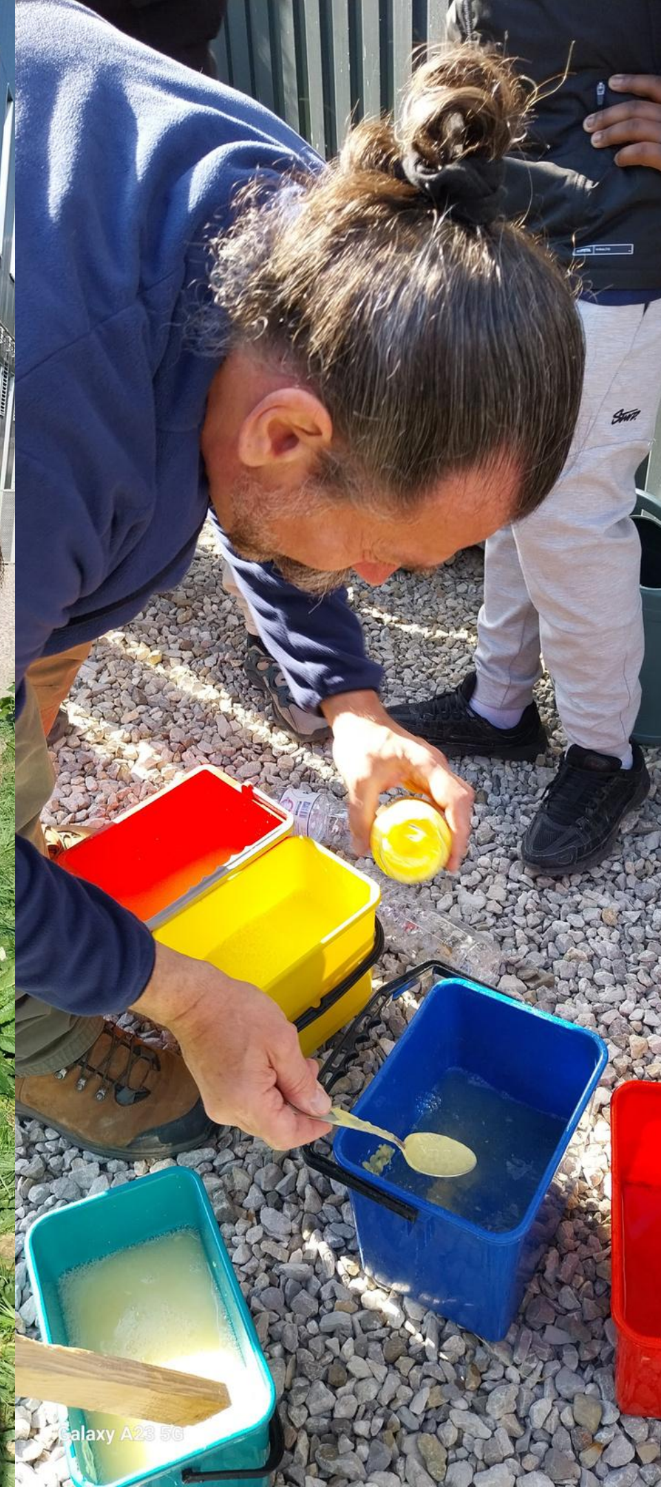
Galaxy A23 5G