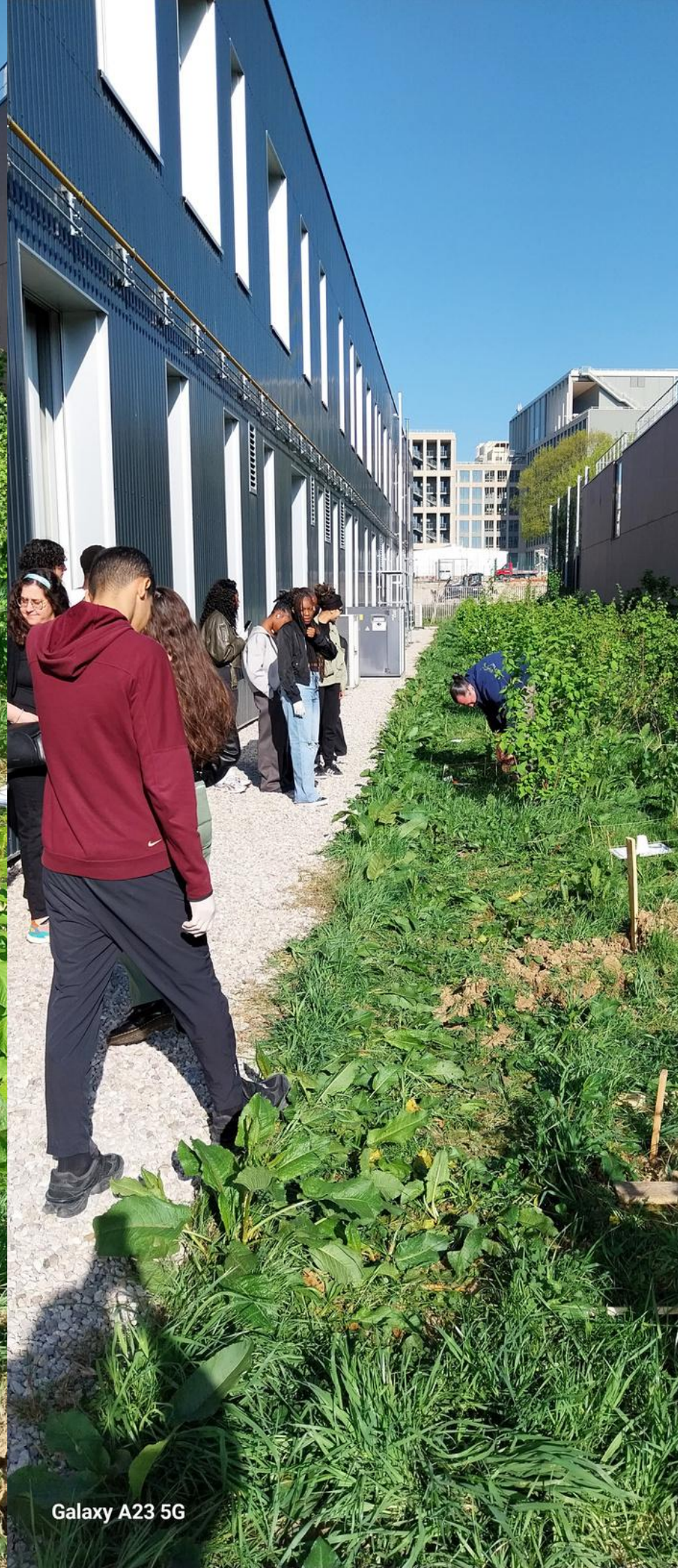
Galaxy A23 5G