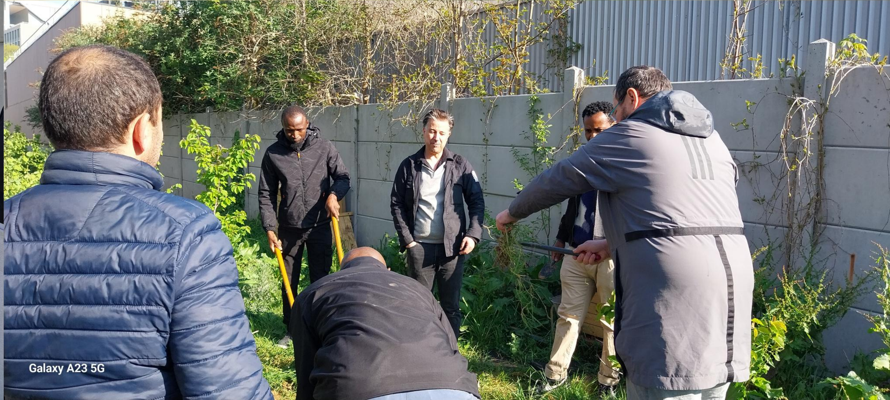
Galaxy A23 5G