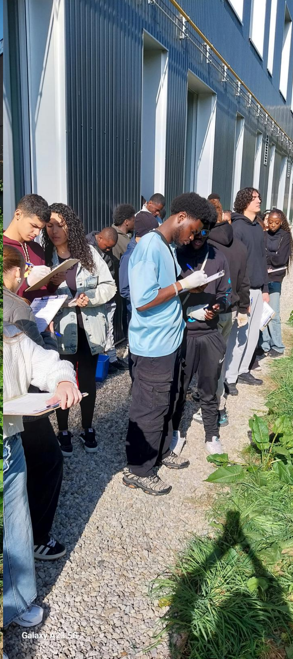
Galaxy A23 5G