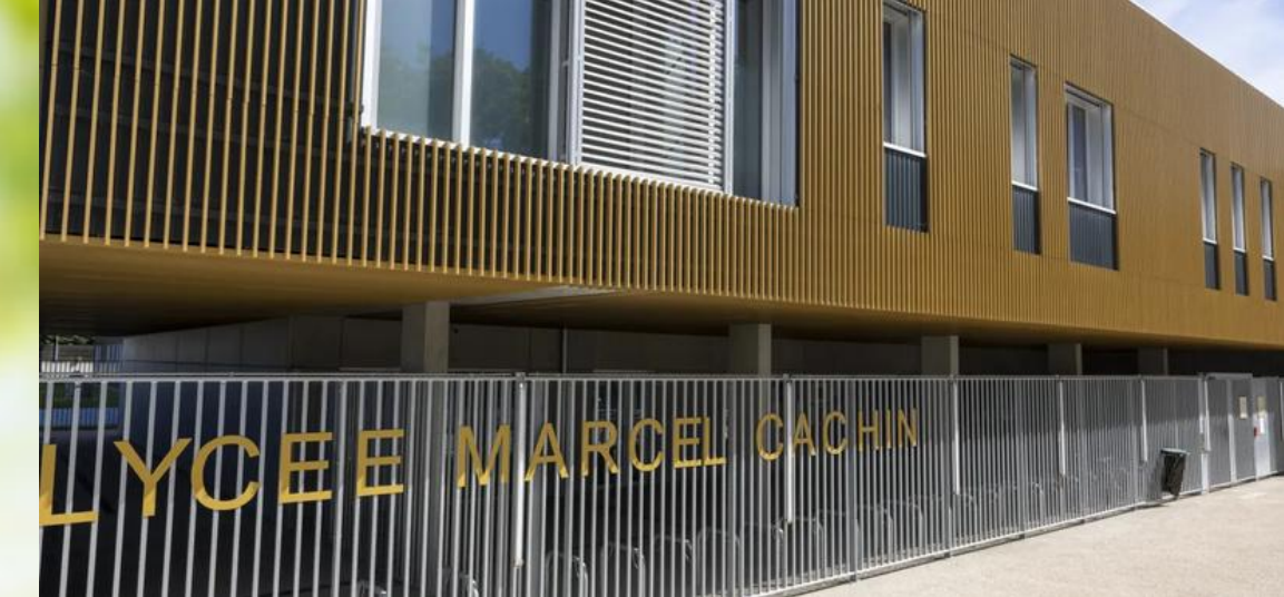
Lycée Marcel Cachin

les élèves deviennent ambassadeurs et co-pilotes