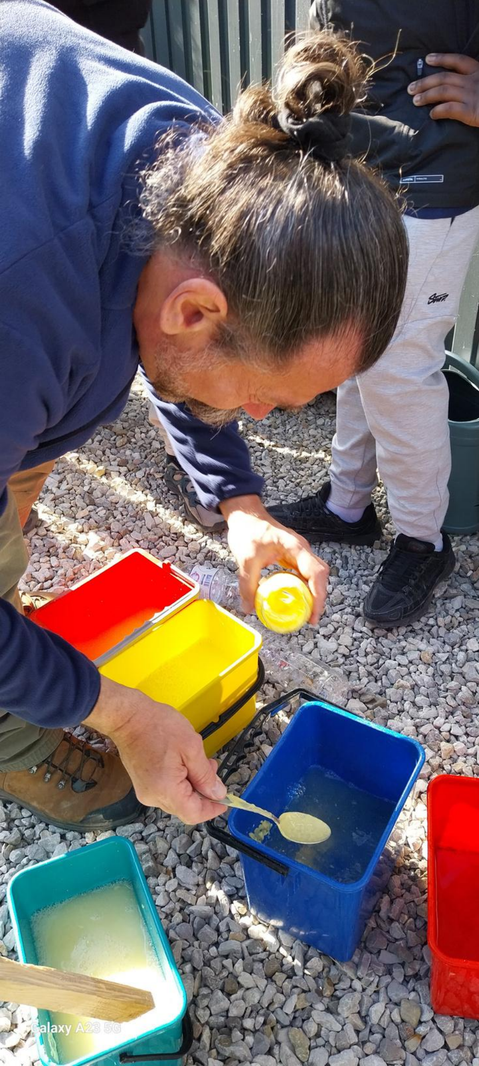
Galaxy A23 5G