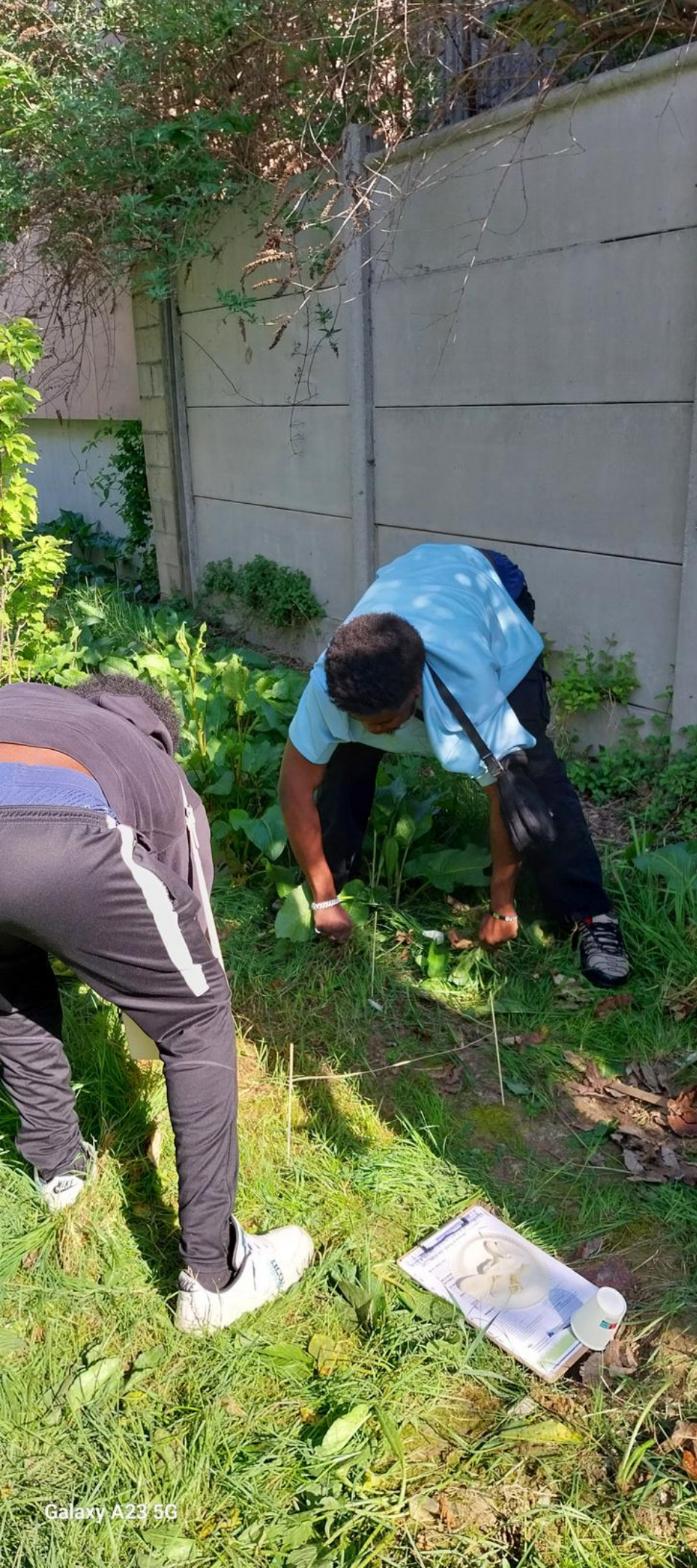
Galaxy A23 5G