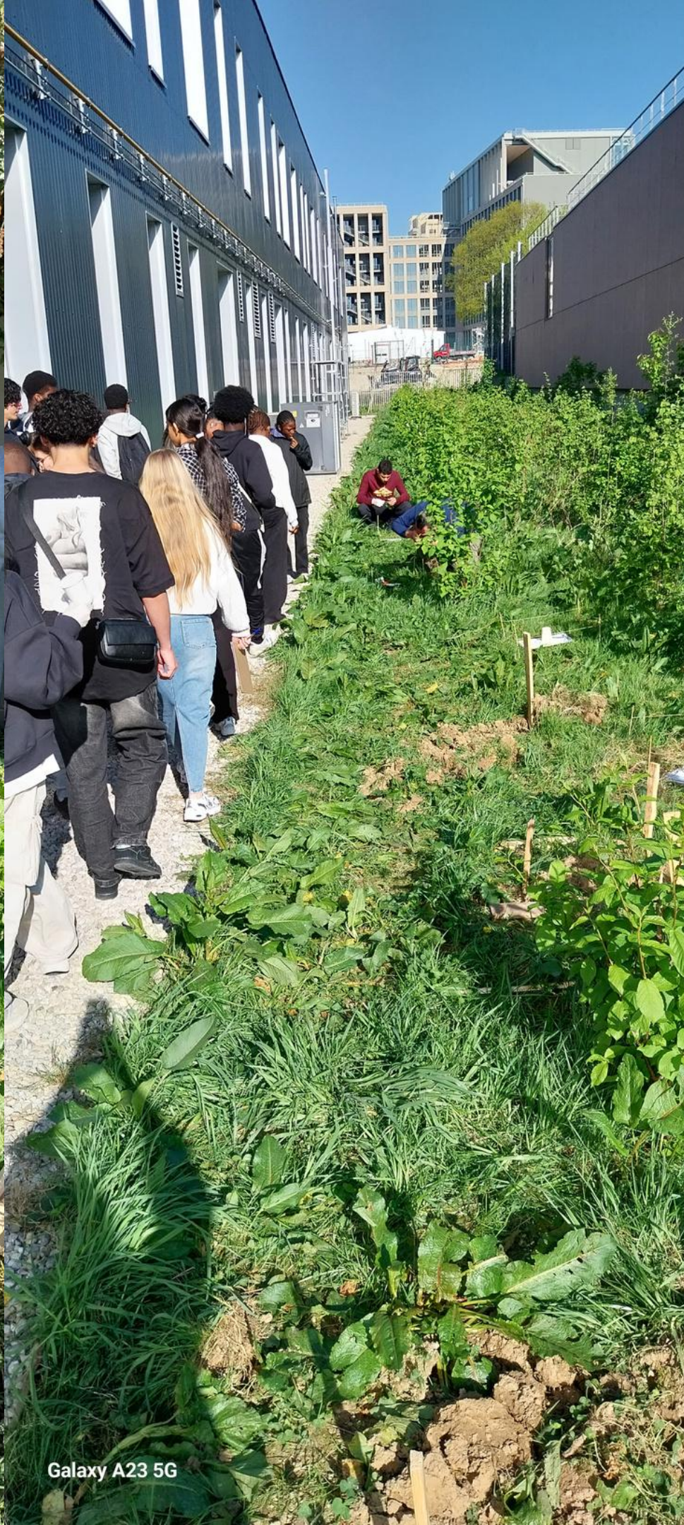
Galaxy A23 5G