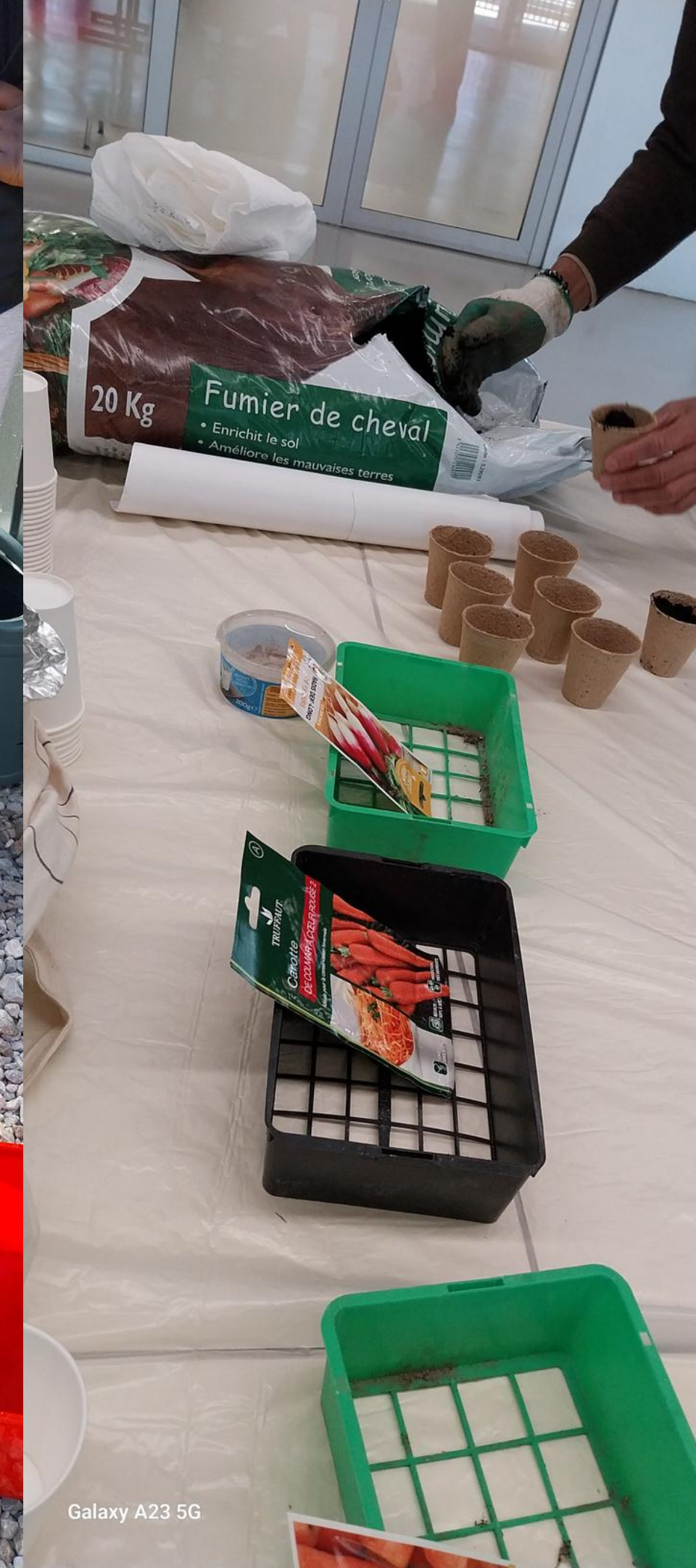
Galaxy A23 5G