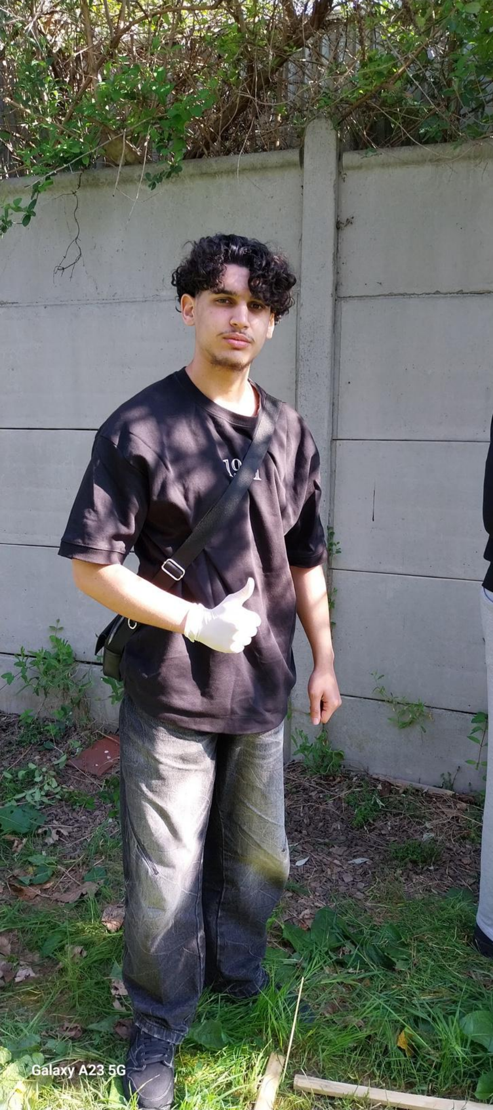
Galaxy A23 5G