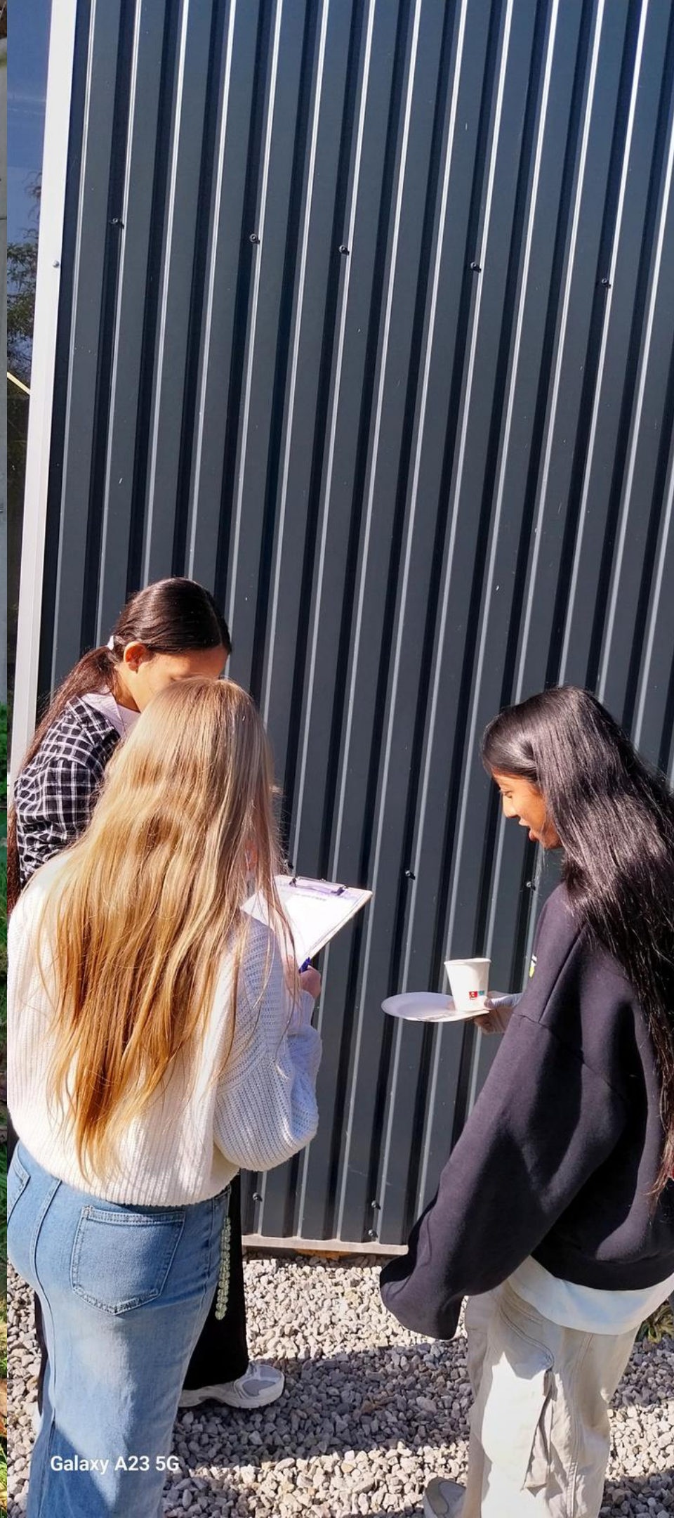
Galaxy A23 5G