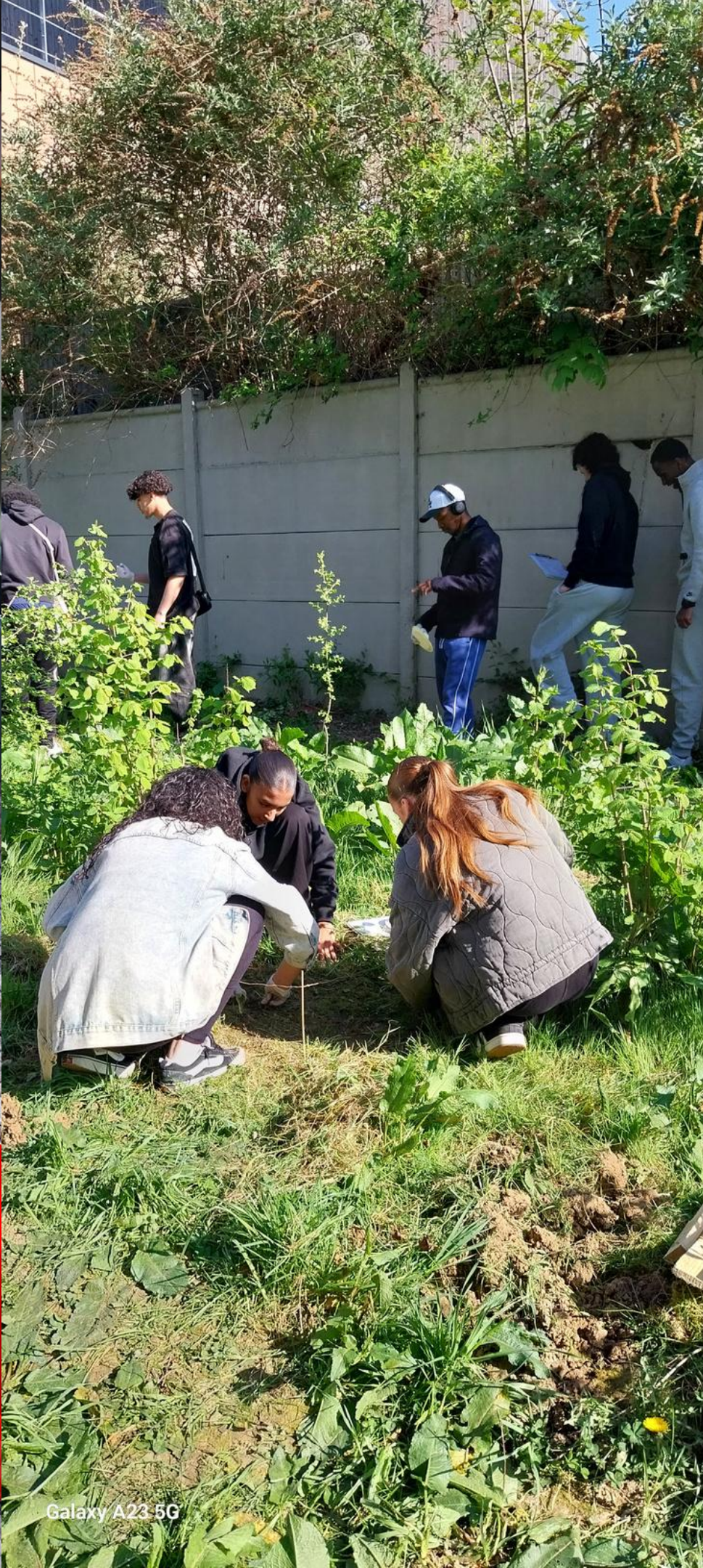
Galaxy A23 5G